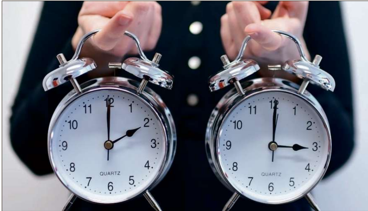
La Svizra ed er l'entira UE midan la dumengia che vegn sin il temp da stad.