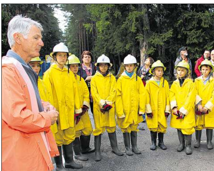
Egn digls instructours fò attent agl priewel tgi dat tar avas grondas.