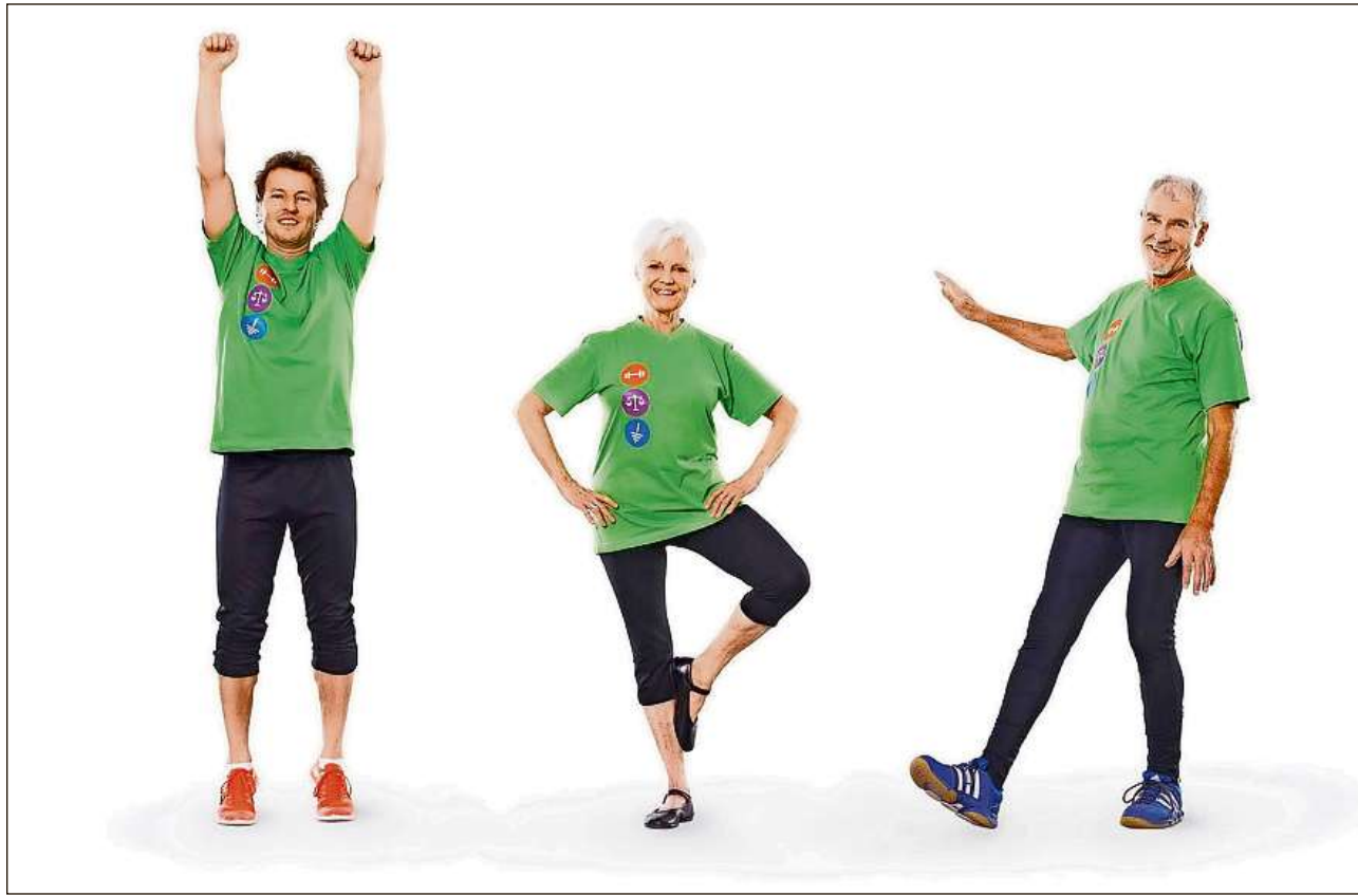
Cun ruclar mieran mintg'onn varga 1300 persunas. Quei sto buc esser, dian il PPA e la Pro Senectute e lantschan ina campagna da prevenziun.

Suenter ina cupitgada ei bunamein nuot pli sco avon. Mintg'onn mieran 1330 persunas sur 60 onns en consequenza d'ina cupitgada, 12000 persunas rumpin in calun. Mo era blessuras meins grevas san haver bravas consequenzas. Suenter la rutadira d'in maun ni ina scurlada dil tschurvi piardan persunas pli veglias