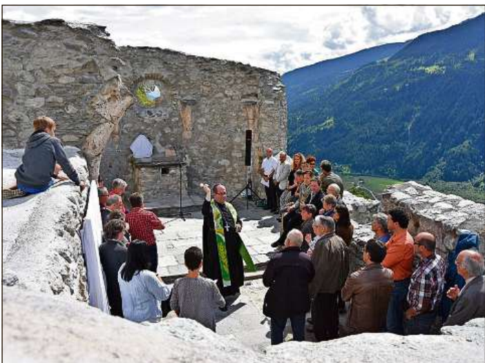
Dumengia vargada ha igl avat Vigeli Monn benediù la ruina dalla caplutta da Sogn Benedetg.