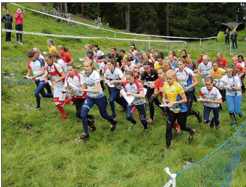
La partenza da las duonnas sül Ranschun.