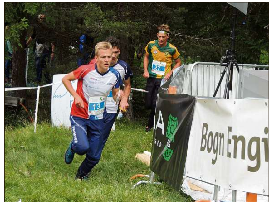
Divers cuorriduors cuort avant il böt.