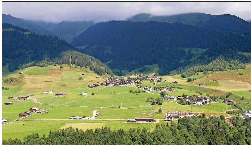
La zona da mistregn sut Segnas vegn engrondida, denton buc aschi fetg sco quei che la vischnaunca giavischa.