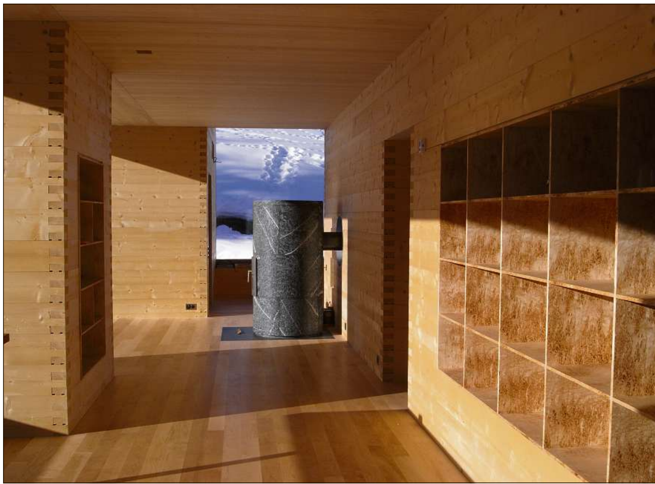
L'interpresa da pegnas scalegl Giger SA less ereger in niev luvratori cun ina gronda exposiziun ella zona da mistregn sut Segnas a Mustér. Nossa foto muossa ina da sias pegnas construidas per in client.