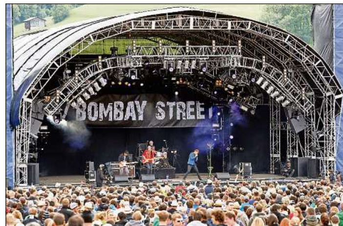
18 000 visitaders a l'Open Air Lumnezia han empli las cassas.

suentermezdi ha l'areal da l'open air gi per quatter uras nagina electricitad, quai pervia da plirs chamegts che han interrutt las lingias d'electricitad en la Val Lumnezia. Entras questa interrupziun haja l'open air, tenor Cavegn, pers ina svieuta da 30 000 en fin 40 000 francs. Per l'onn proxim è previs d'installar in generatur per evitar tals problems en l'avegnir.