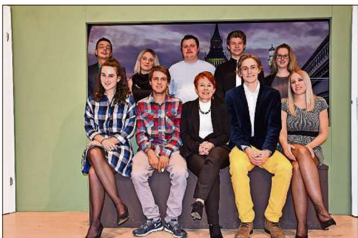
L'Uniu dramatica Breil presenta la cumedia «Tut mo engulau».