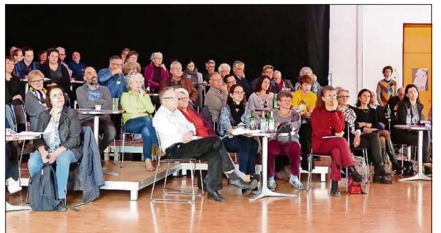
La sala polivalenta Tircal era er tar ils 26avels Dis da litteratura a Domat adina bain occupada.