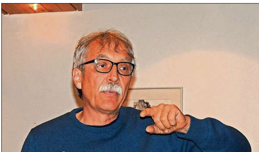
Il ravenda Jon Janett s'ha fat impissamaints davart üsanzas.

chasa restessan sco fin qua, vuol dir trais fanestras da la fatschada vers mezzanot gnissan serradas causa l'ascensur chi douvra quella piazza. Eir las fatschadas vessan dabsögn d'üna cosmetica e per quel scopo daja plüssas variantas. Üna prevezza üna simpla adattaziun cun cuosts da raduond 50 000 francs ed ün'otra ün'isolaziun da ses centimeters cun üna rebocadüra concipada aposta per chasas istoricas chi cuostess intuorn 210 000 francs. Ils adattamaints interns chaschunan cuosts da raduond 800 000 francs exlus las fatschadas. Sco prossem pass sto gnir decis che varianta per las fatschadas chi gniss in dumonda per realisar ün proget e per far ün'eventuala dumonda da fabrica. Quella decisiun ha eir ün'influenza sün eventualas contribuziuns da la protecziun da monument e d'otras instituziuns. La radunanza ha approvà ün import dad 80 000 francs pel proget.