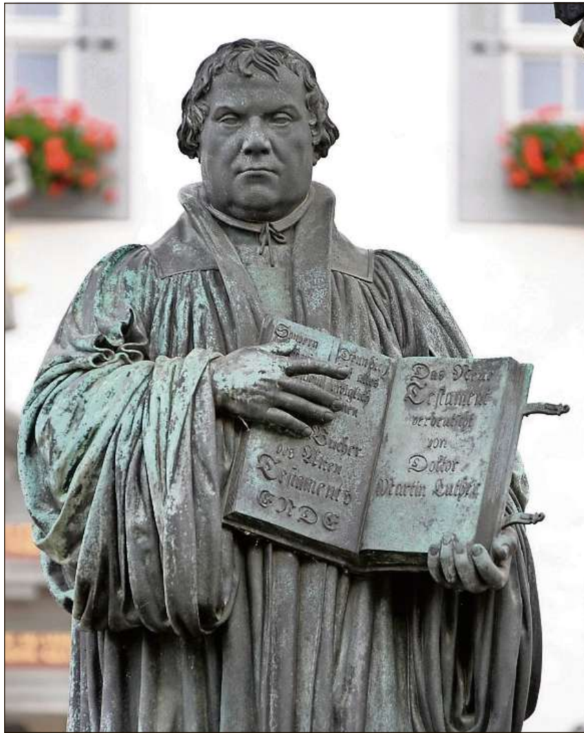
Il monument da Luther sin la piazza da fiera a Wittenberg, Sachsen-Anhalt. Il monument il pli vegl dal reformatur è vegni creà da Johann Gottfried Schadow.

Ina gronda part da la misergia e paupradad sin quest mund deriva da las guerras multifaras. En ils davos onns dal tschientaner passà ha il teolog Hans Küng (Universitad da Tubinga) formulà dus postulats fundamentals per cumbatter la guerra: «Nagina pasch senza pasch tranter las religiuns. Nagina pasch tranter las religiuns senza dialog tranter las religiuns.» Papa Francestg conferma questas reglas. Ils 13 da favrer 2016 è el s'entupà sin l'isla da Cuba cun patriarc Ciril «da Moscau e da l'entira Russia», pia d'in intschess da strusch 17,1 milliuns km 2 . Lur declaraziun cuminaivla ha punctuà dumondas fitg impurtantas, sco il restabiliment da la pasch en Orient (§ 11), «il dialog necessari tranter religiuns» (§ 13), «las ragischs cristianas cuminaivlas» (§