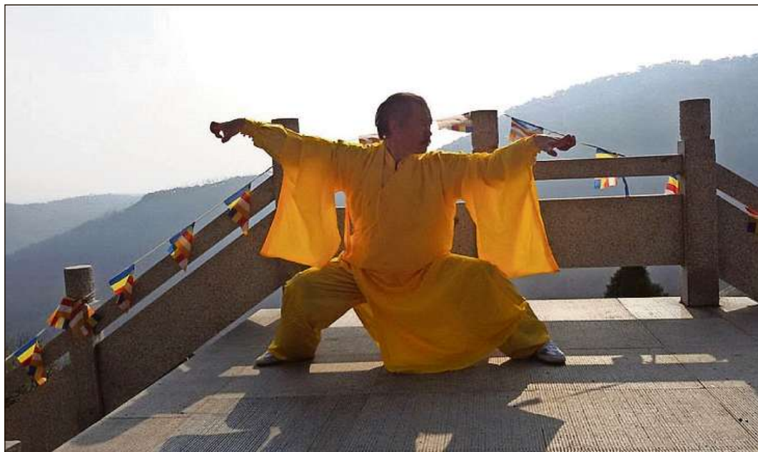
Ün muong dal Shaolin pro seis exercizis.

Passa 50 persunas sun seguidas a l'invid per üna sairada d'infuormaziun illa sala polivalenta da Tschlin. Biert ha preschantà sia visiuon dal center da bainesser. «Tschlin es ün lö ideal per as retrar da la hectica da la vita dal minchadi», ha dit Biert. Per el es il cumün, chi'd es situà sün üna terrassa da sulai, ün lö central in Europa: «Las citats sco Puntina, Minca o Milan sun bain ragiundscha-blas e quai in cuort temp.» Sia spüerta da terapias chinasas es unica in tuot l'Europa ed i'l center stan las metodos dal Shaolin, Tai Chi e Qi Gong. «Il böt da quistas terapias es d'evitar malatias, da tillas guarir e da stabilisar la sanda. Ellas mettan in consonanza il corp cun l'orma», ha'l declarà. Tenor el as tratta qua da metodos chi's cugnuschia illa China fingià daspö millenis. «Daspö ün pèr ons vegnan ellas, per part, arcugnuschüdas da las chaschas d'amalats e da la medicina classica.»