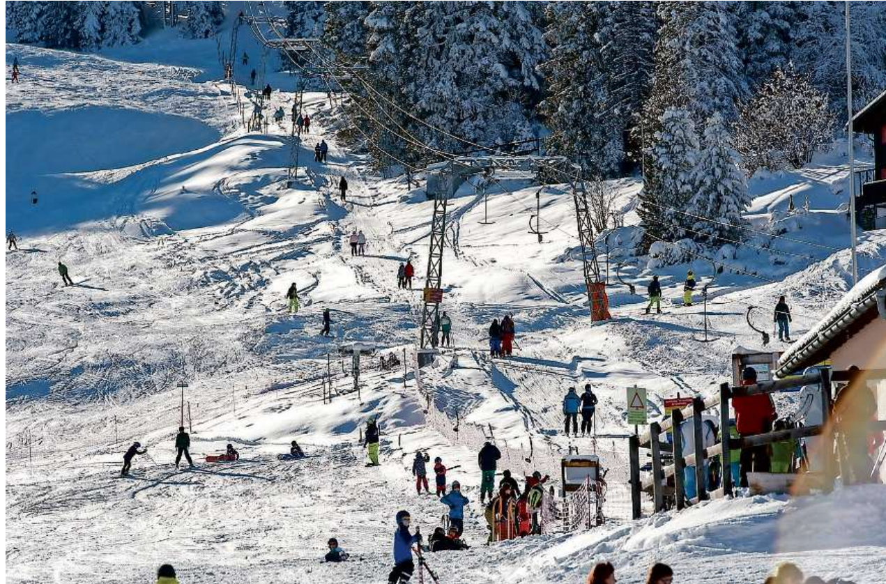
Dank der Sonderaktion «Uffa!» kamen bis zu zehnmals mehr Gäste auf den Churer Hausberg Brambrüesch.