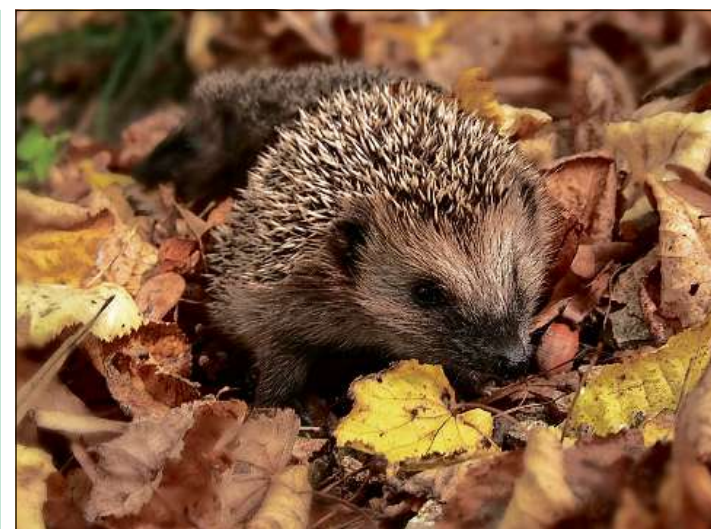
La rizza as zoppa gugent in mantuns da föglias.