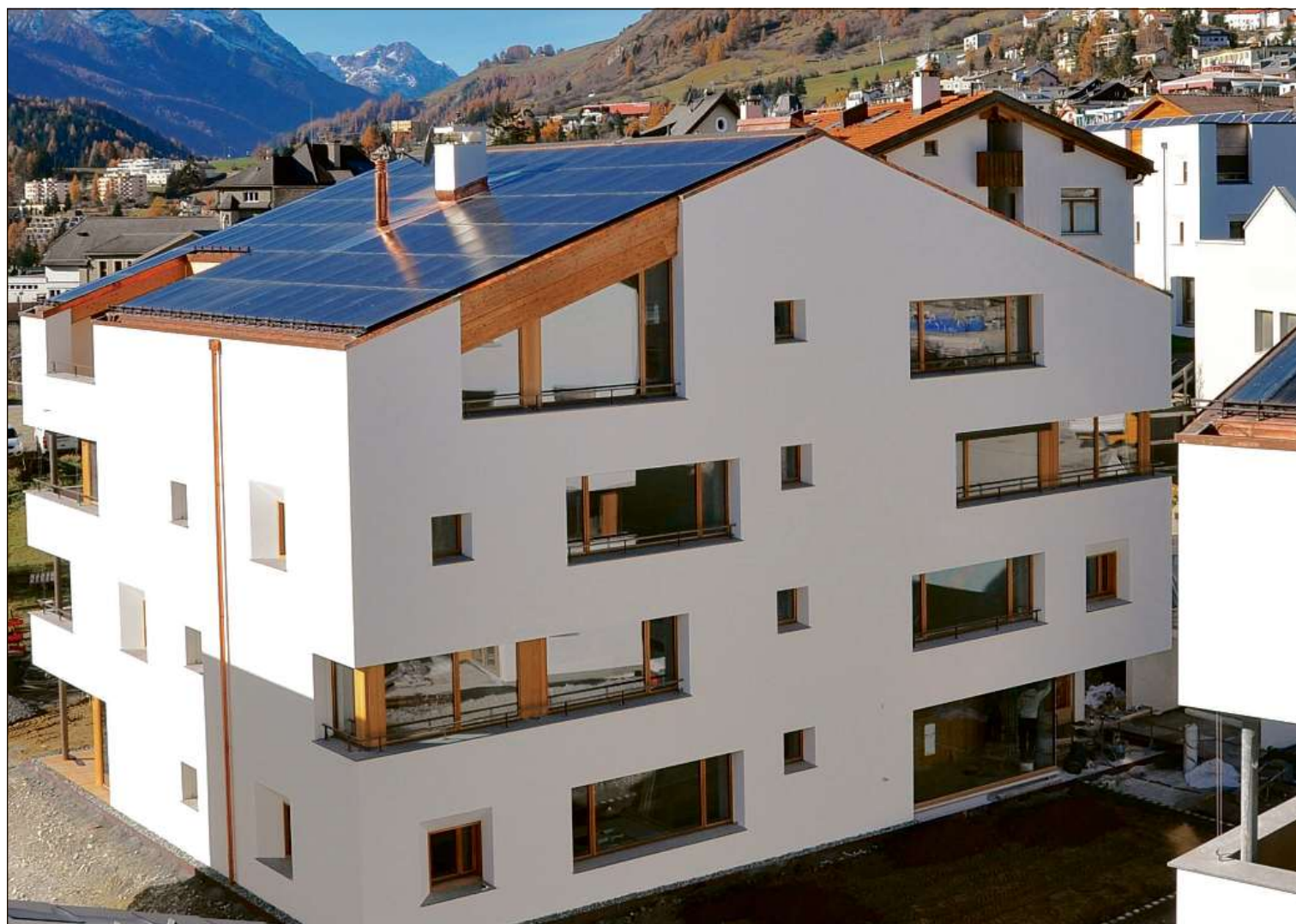
Las alas vers il sulai dals tets da las chasas da la surfabricaziun Monolit a Scuol sun munidas cun grands implants da fotovoltaica.

Daplü davart quista dieta as chatta sün www.swissolar.ch/solarwaerme-ta-gung-2017/