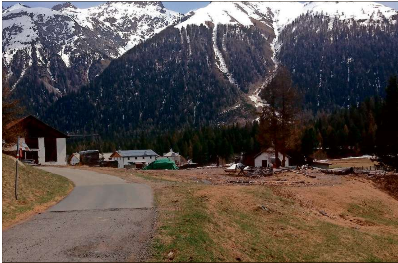
Vista da la zona Resgia Chapella vers süd.