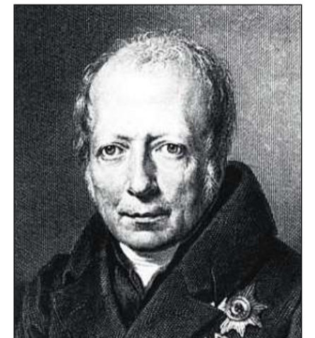
Wilhelm von Humboldt, diplomat e linguist.

s'interessava pil lungatg romontsch; cura ch'el habitava a Vienna, correspondeva el cul reverend Matli Conrad d'Andeer. Ins savess sedumandar sche Humboldt e Planta hagien buca giu conversaziuns linguisticas duront las pausas dil Congress!