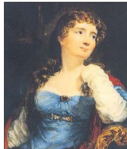
Annabella Milbanke (pli tard Lady Byron).