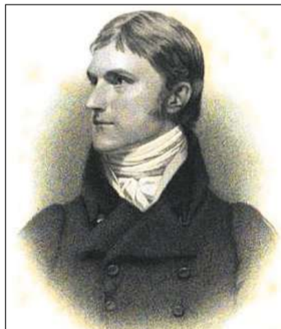
Stratford Canning, diplomat engles.