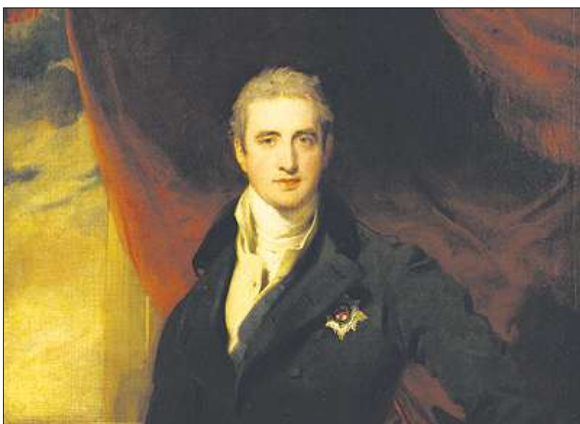
Lord Castlereagh, minister engles digl exteriur.

1844, ella perioda dalla regina Victoria, ha Planta stuii seretret dalla politica per motivs da sanadad, ed el ei morts a Londra 1847. El e sia dunna Charlotte han buca giu affons; els eran probabla-mein memia vegls. Il fideivel Stratford Canning a descret Joseph Planta suenter sia mort sco «in amitg buntadeivel e da bien cor, ed in excellent um d'affars». El ei staus il davos dils Plantas engles.