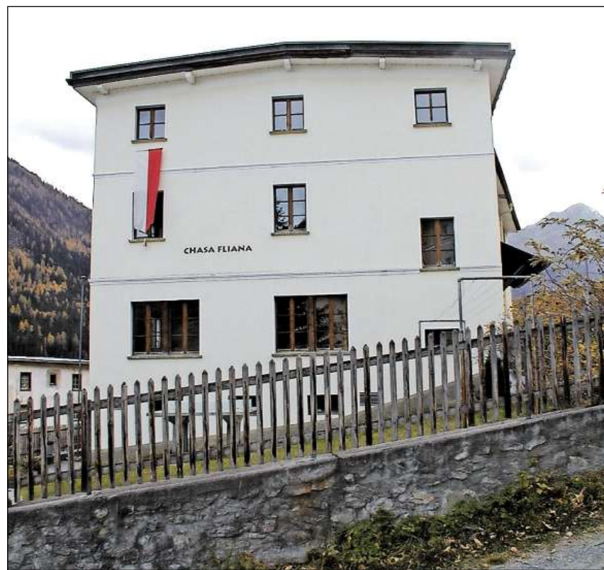
Ils responsabels da la Chasa Fliana a Lavin vaivan invidà ad ün di da las portas avertas. MAD

Las 105 personas preschaintas han approvà differents credits per totalmaing 373 000 francs. Per pudair infuormar als indigens sco eir als giasts prevezza il cumün da Zernez d'installar in mincha fracziun almain üna tabla d'infuormaziun electronica. Ils cuosts s'amuntan a 150 000 francs per quatter tablas digitalas e pellas investiziuns necessarias sül