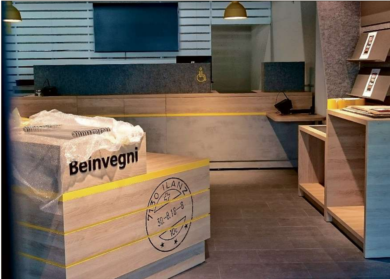
Il spurtegl dalla posta nova a Glion el niev Center Marcau ei semtgaus damaun marvegl.