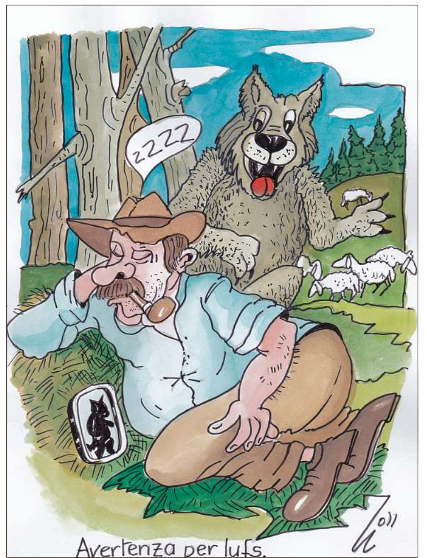
Avertenza per lufs.