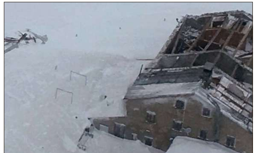
Ils vents han stratg cun sai la gronda part dal tetg da l'ospiz sin l'Alvra.

Suenter mesanotg èn lura stadas pertugadas perfin 24'000 chasadas engiadinais – ellas sajan stadas per 10 minutas senza electricità. Quai pervi che vents fermes avevan engrevgià la funcziun da la lingia d'electricità dal Pusclav sur il Bernina en Engiadina. Las 00.58 èn lura er anc ina giada radund 3500 chasadas en la Valposchiavo stadas 13 minutas senza electricità pervi d'in disturbi en la staziun da trafo a Campocolgno.