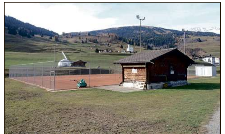
Qua nua nua che la piazza da tennis sa chatta pudessi en l'avegnir dar parcadis.