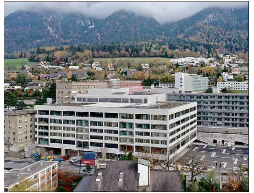
Il nov tract da la staziun d'intensiva da l'Ospital chantunala a Cuir porscha 42 plazzas equipadas cun apparats da respiraziun. Quella po uss vegnir averta gia l'avrigl e betg pir il matg.

Tenor la regenza grischuna n'ademplescha actualmain ni l'entir chantun ni singulars regiuns questas premissas. Il provediment da sanadad saja garantì en l'entir chantun. La regenza saja dentant pronta d'observar permanentamain la situaziun cunzunt en las regiuns talianas en il sid