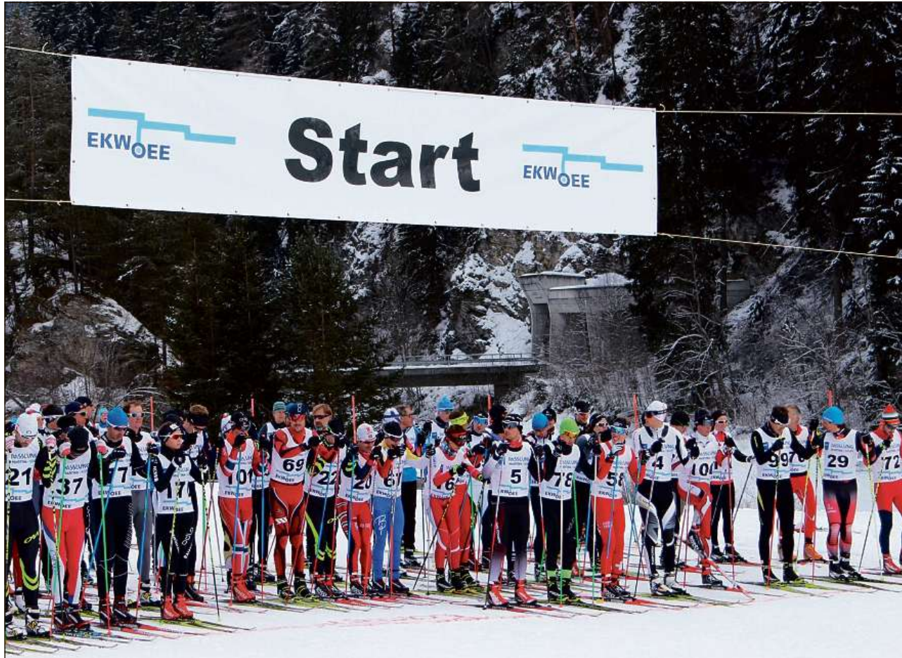
Passlunghistas e passlunghistas pronts per la partenza a Martina.