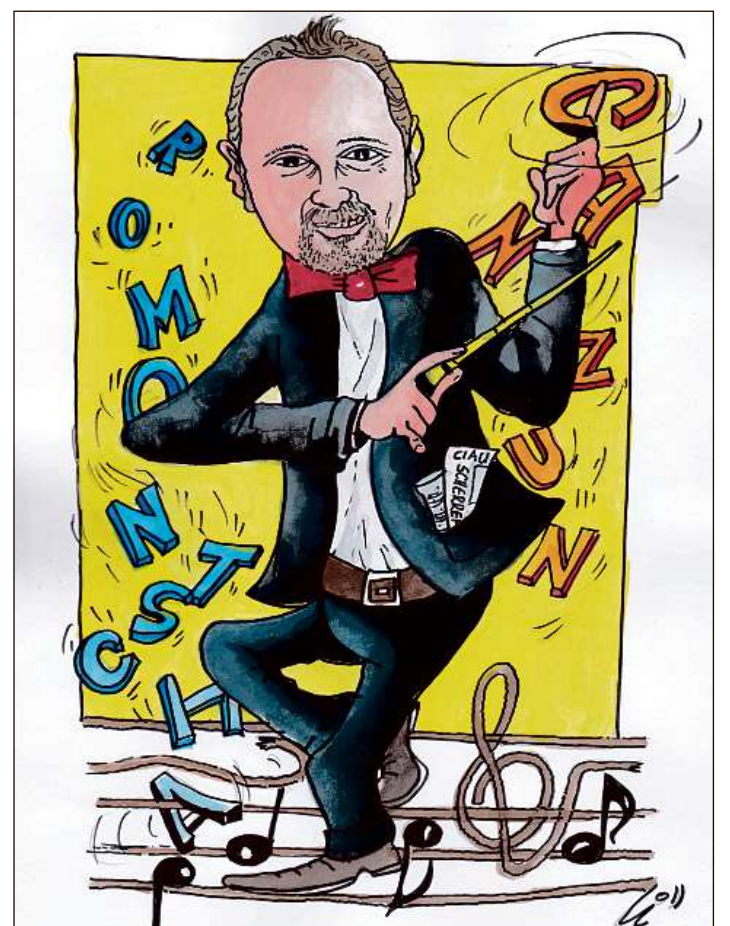
CARICATURA L. FLEPP