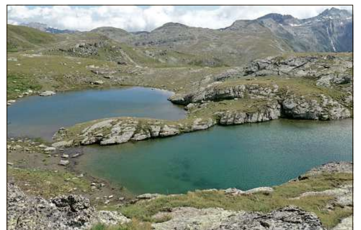
La ruta passa er tar ils Flüaseen tranter Giuf ed il Stallerberg.

La maioritad dals Svizzers e da las Svizras van gugent a lavurar. En ina retschertga han 87% inditgà dad esser cuntents u fitg cuntents cun il job – quai è circa uschè bles sco l'onn passà. Differenzas datti dentant aifer las branschas. Tar l'industria da construcziun e la construcziun da maschinas è s'augmentada fitg ferm la cuntentientscha. Pli pauc cuntents èn ils Svizzers e las Svizras en il secur da bancas ed assicuranzas.