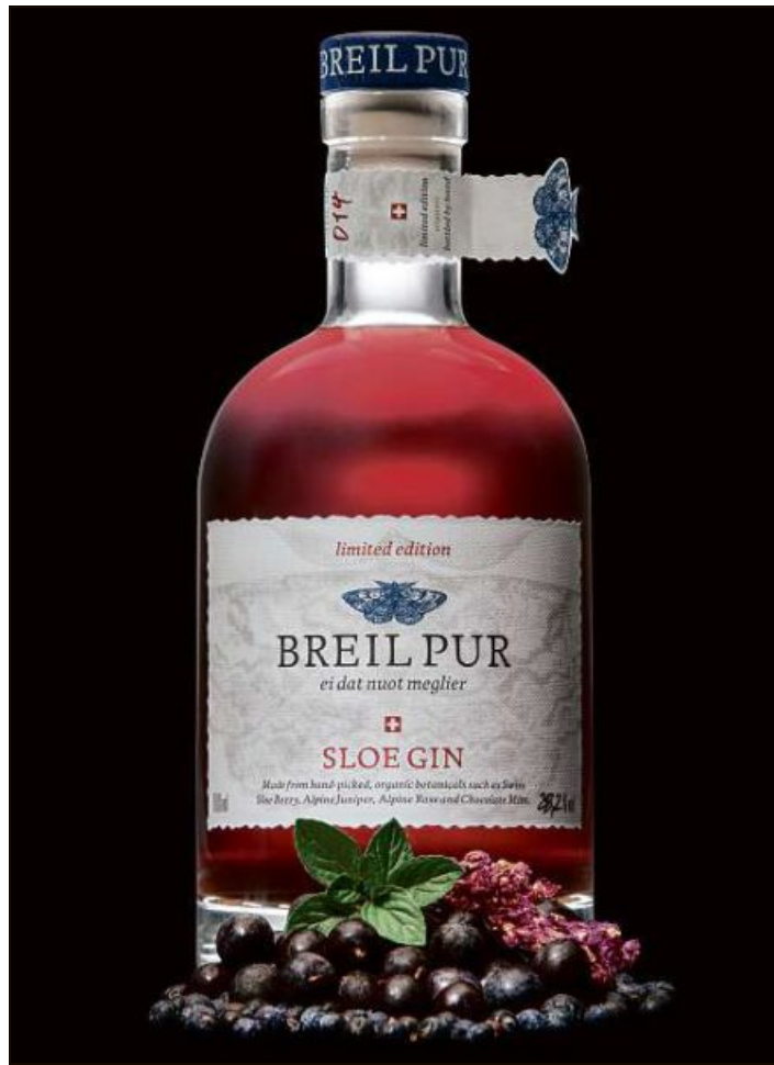
Gia suenter siat onns ei la produzioni dil gin da Breil a fin. Ils possessurs da Breil Pur han buc anflau successurs e calan cun la produzioni. MAD