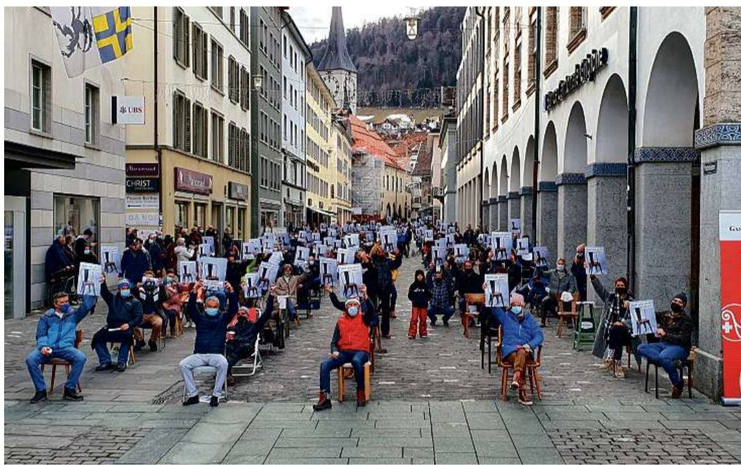
Gastronomas e gastronoms dal Grischun a la demonstraziun paschavla dad ier a Cuiria.