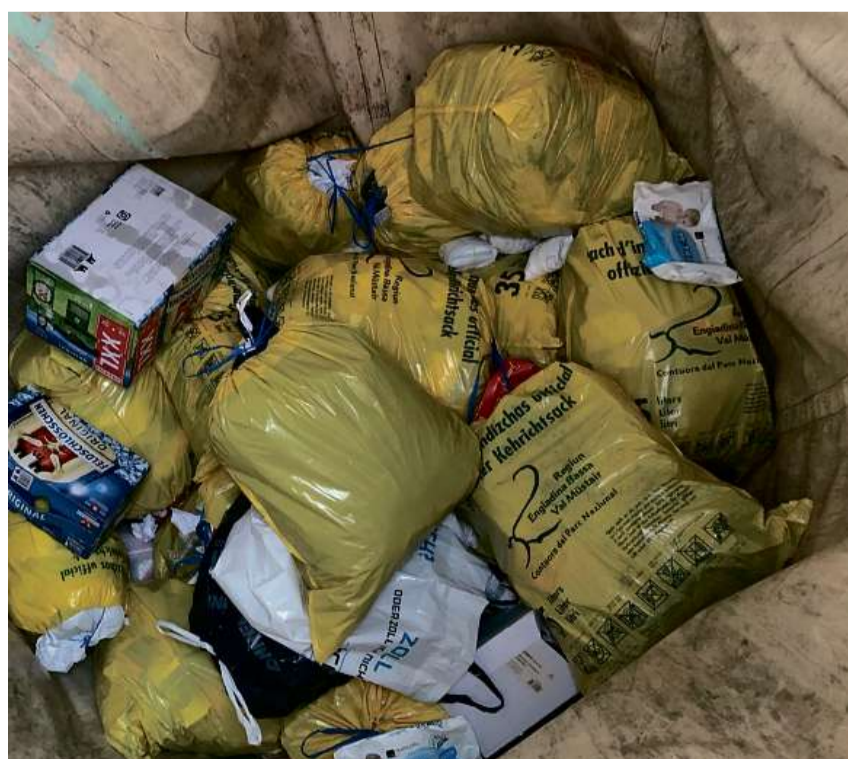
Il sguard in ün recipiant pels sachs ufficials.

In l'ultim Mas-chalch dal cumün da Scuol es gnü fat l'avis cha cigaretas nu toccan aint ils tombins. A blera glied nun esa consciant cha rests da cigaretas sun s-chart special toxic. Uschè vain il lectur a savair cha quists rests cuntengan «var 7000 chemicalias da tössi, tanter oter nicotin, arsen e metals greivs». Ri-