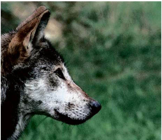
Il luf occupa vinavant la politica.