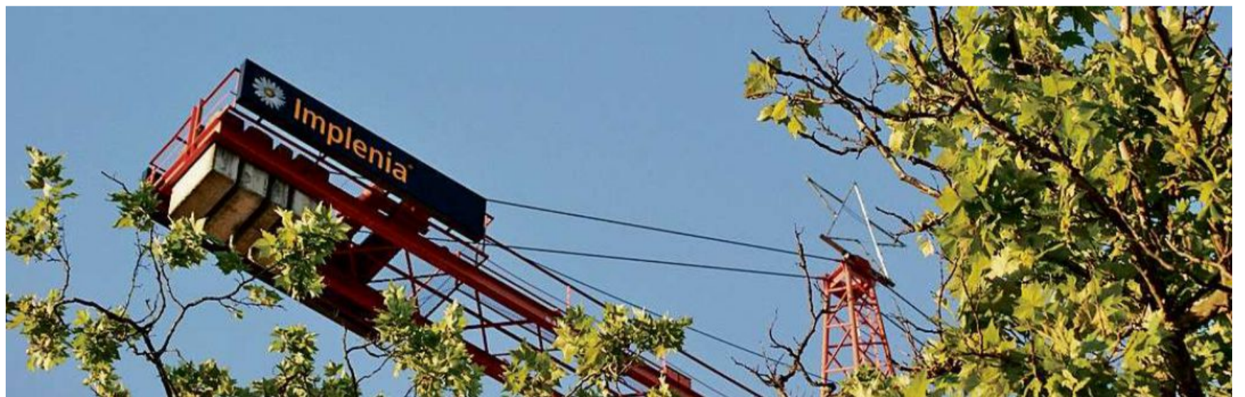
Il concern svizzer Implenia reducescha sias sedias en il chantun Grischun.