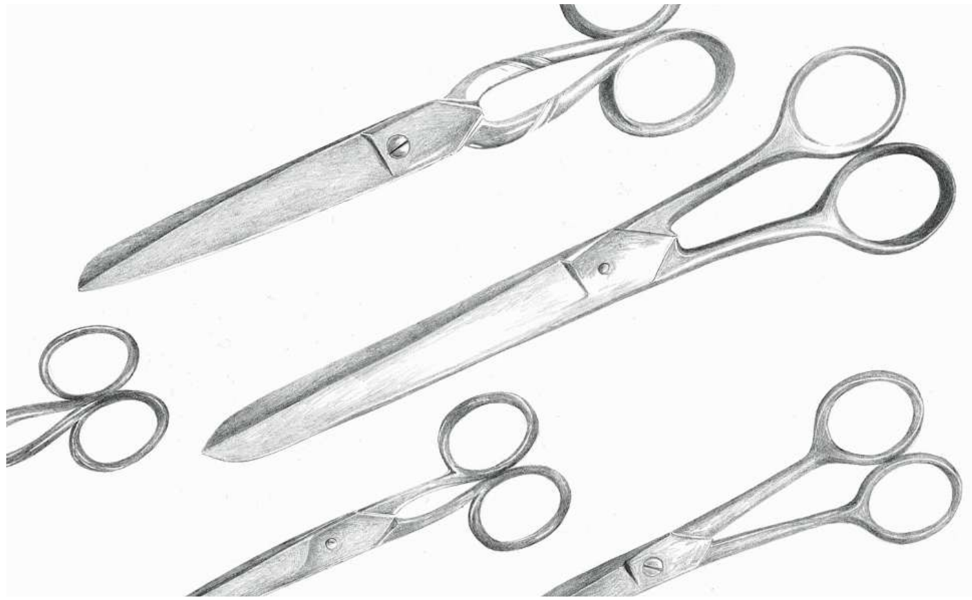
Per la publicaziun da Dumenic Andry ha l'illustratura Pia Valär dissegnà in entir catalog dad objects divers – p.ex. differentas forschs ed in cuntè (surtant) en il chapitel «Oter». ILLUSTRAZIUNS PIA VALÄR/CHASA EDITURA RUMANTSCHA

èn najadas l'onn 2022 en ils lais, flums e bogns svizzers. Quai ha la Societad svizra da salvament (SSS) communitgà dacurt. Uschia èn tantas persunas disgraziadas en l'aua sco dapi l'onn 2003 (cun la stada da chaliras) betg pli. L'organisaziun declera questa cifra sur la media cun la blera gliud ch'ha passentà pervi da las chaliras il temp liber sper u en l'aua. (cdm/fmr)