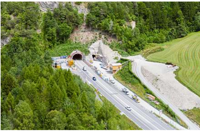
Il grond plazzal al tunnel «Isla Bella».