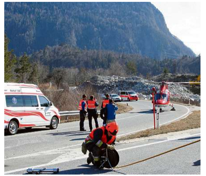
Dapli effizienz per ils servetschs da salvament dal Grischun.