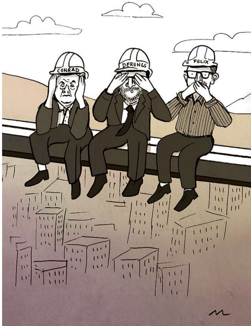
Tranter auter vegn la tematica dal cartel d'impressaris da construcziun tematisada en in text e cun in'illustraziun da la caricaturista Marina Lutz.

Na, jau sun simplamain ina persuna da linguas. Da pitschen ensi viv jau cun differents linguatgs, en famiglia avevan nus gia adina in pau scrotas dad auters linguatgs. Quai è per mai tut natural da prender differents linguatgs.