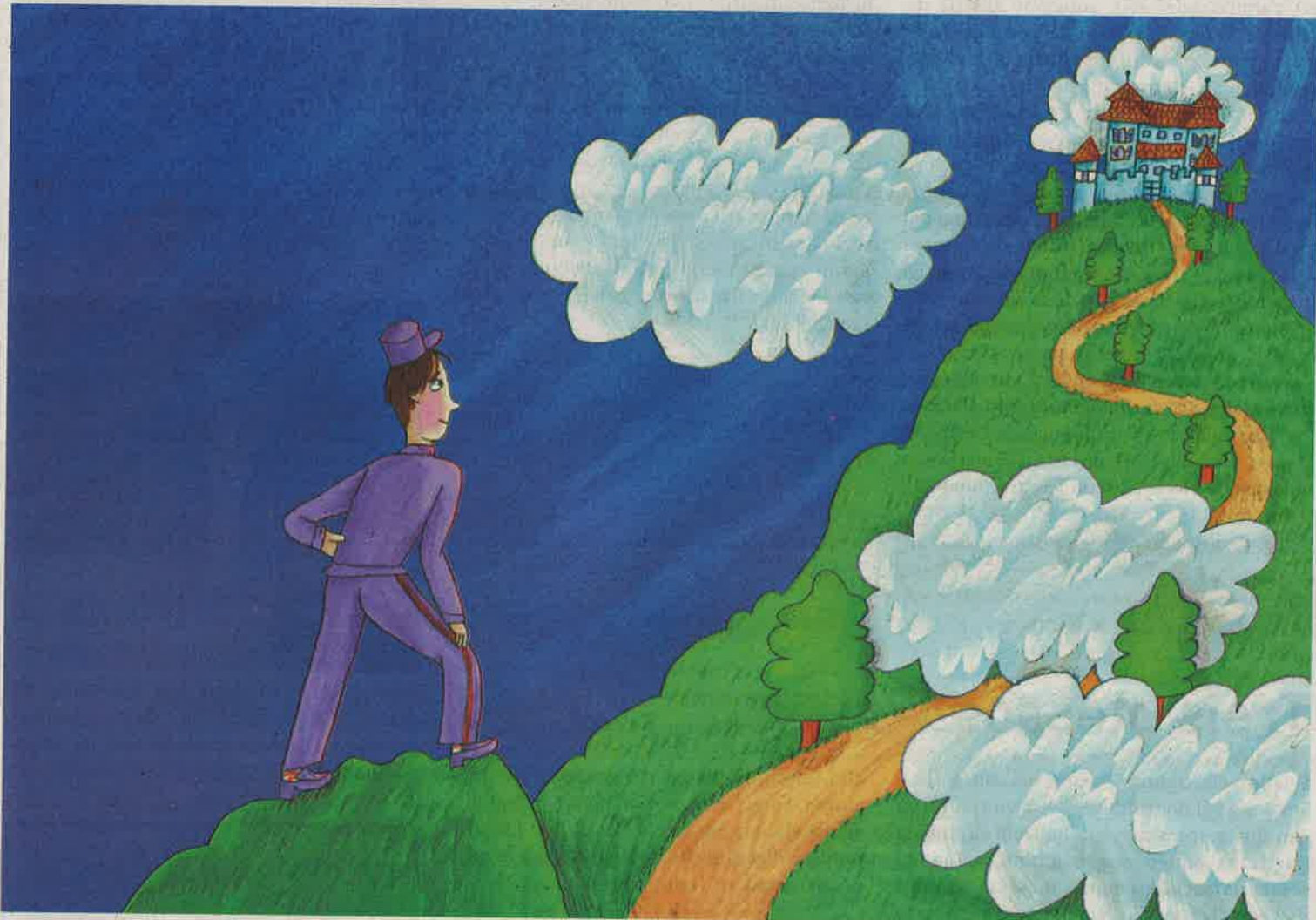
Dumengia ò li la vernissascha digl nov codesch Gion tgavrer, tgi rachinta da Gion e la sia aventura an teras estras.