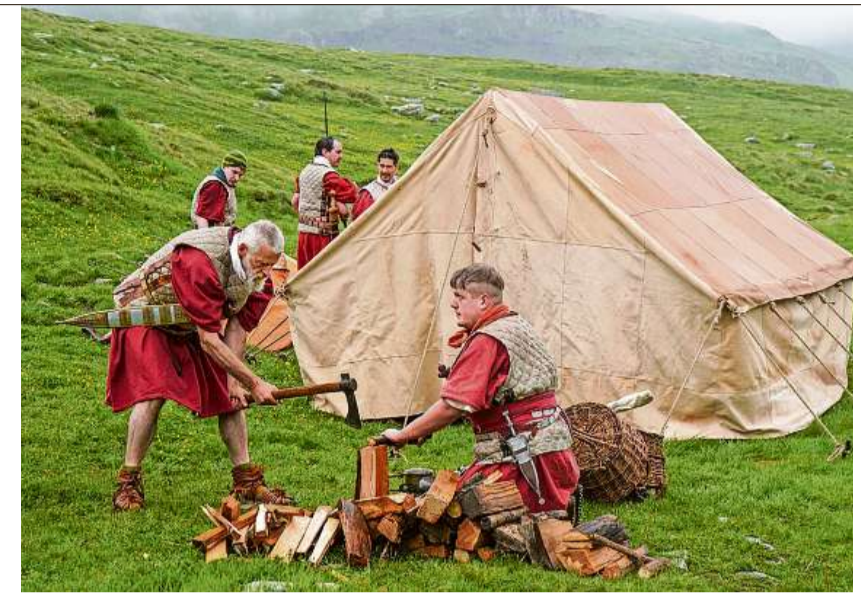
Holz hacken fürs Einfuern: Auch der Aufbau eines Zelts und das Lagerleben werden von den Statisten möglichst originalgetreu imitiert.