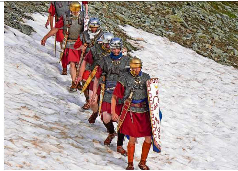
Mit Sandalen durch den Schnee: Für die Sendung «EinStein» von SRF stellt eine Gruppe Statisten im Sommer 2024 am Septimer römische Legionäre nach.