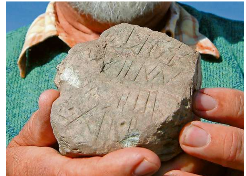
Ein besonders wertvoller Fund: Bei den Ausgrabungen kam auch dieser beschriftete Stein zum Vorschein. Auf ihm wird unter anderem die 12. Legion genannt.