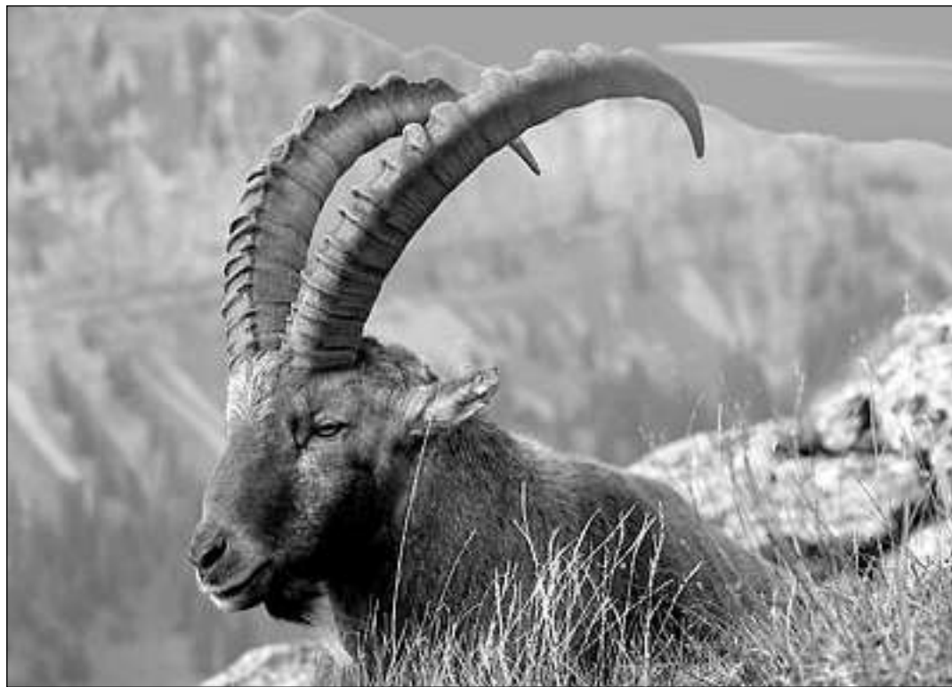
Cun star a sulegl durant igl unviern augmenta il capricorn la temperatura da siu tgierp. 10

Quei augment dalla temperatura preten-da denton temps: Las enconuschientschas fatgas dils perscrutaders muossan ch'ils capricorns semovan fetg pauc la damaun e quei sulettamein dil liug nua ch'els han passantau la notg entochen tier loghens suleglvis. Entochen ch'il sulegl ha scaldau lur tgierp cuoza ei magari entochen miezdi. Pér lu entscheivan els a semover pli fetg. Tenor ils perscrutaders enconuschent ins quella metoda da star a sulegl e da rimnar cheutras energia sulettamein tier reptils ed animals lactonts pigns sco per exempel ina specia da mesas schemias. Che animals gronds sco il capricorn nezegian quell'energia en ina tala dimensiun era aunc nunenconuschent.