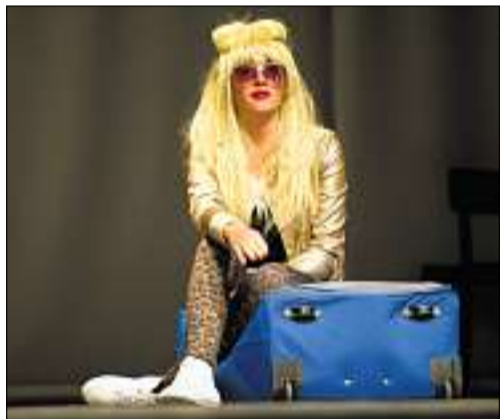
«Was wetsch?!»: Der Traumberuf dieser Schülerin ist Modedesignerin.