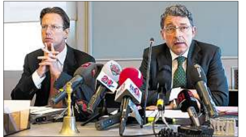
Heinz Brand, Nationalrat (SVP/GR) und Präsident der Immunitätskommission (rechts), und Christian Lüscher, Nationalrat (FDP/GE).

Als Nächstes muss die Kommission klären, ob die Handlungen Blochers, in welchen die Zürcher Staatsanwaltschaft eine mögliche Verletzung des Bankgeheimnisses sieht, in unmittelbarem Zusammenhang mit dessen parlamentarischer Tätigkeit stehen. (sda)