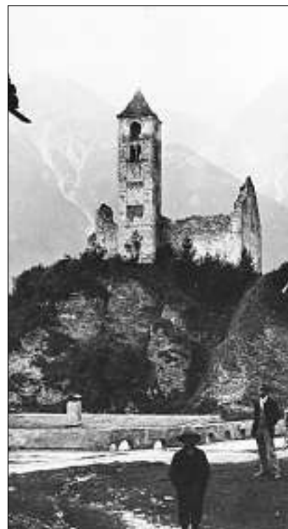
La ruina da la Baselgia San Peder a Sent intourn il 1900. La Baselgia San Peder fo part dal relasch da Peider Linsel.

saja steda importanta per Peider Linsel: «El d'eira nempe adüna in gir e chüraiva il contact cun sia famiglia perque in scrivand chartas.» Fich captivant saja sto da leger las chartas cha Peider Linsel ho scrit scu iffaunt: «Linsel vivaiva tar üna tanta a Sent e frequentava lo la scoula rumauntscha intaunt cha sieus genituors vivaivan e lavuravan in Italia.» Cha'l bap da Peider Linsel hegia adüna darcho admonieu a sieu figl da's esser consciant chi detta ün Dieu in tschèl chi vezza tuot e chi valütescha impustüt ils noschs fats, manzuna Valär ün dals detagls lets. Ch'el stopcha perque adüna esser ün cher cun sia tanta, imprendere bain e fer da scort, ho Linsel perque let dapü cu be üna gèda. Da l'otra vart as lamantava Peider Linsel illa conversaziun cun sieu bap cha la mnedra da l'institut inua ch'el stübgiaiva saja noscha e sbregia adüna intourn... «Eau d'he let conversaziuns chi m'haun fat rier ma eir da quellas chi m'haun do andit da fer ponderaziuns», managia Valär. Chi saja però in mincha cas sto fich bel da pudair ler chartas chi haun intaunt l'eted da bod 150 ans.