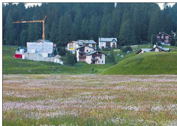
Per la fiera d'immobiglias tutga la UBS il zain d'alarm. Era l'Engiadina'Ota e la regiun da Tavau èn periclitadas d'ina scuffa immobiliare KEYSTONE

entaifer mo sis mais. La UBS taxescha era las regiuns da Tavau e da l'Engiadina'Ota per las regiuns da privel. Tschellas regiuns periclitadas èn: Turitg, Vallada da la Limmat, Pfannenstiel, Zimmerberg, March, Zug, Genevra, Nyon, Morges, Losanna, Vevey, Sutsilvania, la Svizra interna, Basilea-citad, Knonaeramt e la regiun Glattal-Furttal. D'ina scuffa immobiliare possian ins pledar pir sche l'index actual dad 1,02 creschessia sin 2 puncts. En il decurs dals trais onns passads è l'index stà tranter 0 ed 1 punct. Era la Finma (la surveglianza da finanzas federala) e la Banca Nazionale Svizra observan il svilup da las ipotecas cun atenziun.