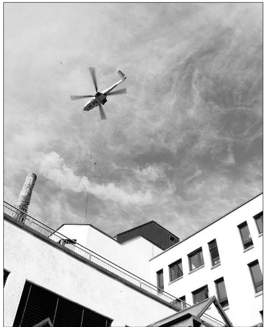
Il Spital regional Surselva ha saviu augmentar il 2012 il diember da cass. Ils delegai han approbau il mardis sera il preventiv cun ina sviulta da varga 29 milliuns francs.