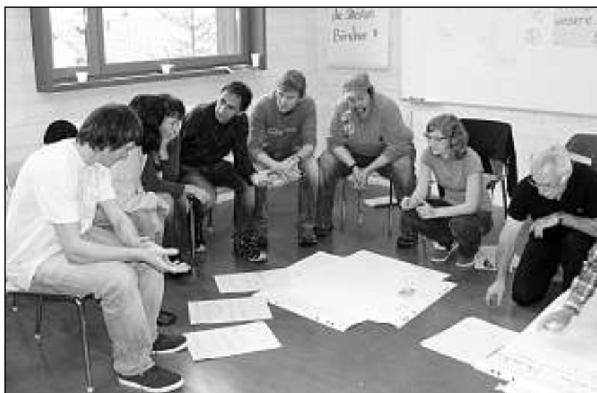
Ei vegn encuretga prumein sligiazuns pil futur sut il credo: «Mo comunablamein savein nus midar enzatgei.»

Lein sperar ch'ei resti buca mo tier ils buns propiests, mobein che la populaziun medelina haji era la curascha da riscar ed empruar enzatgei niev. Far nuot ei in pass anavos ed in vegl proverbii romontsch di: «Tgi che ughegia nuot gartegia nuot.» Ciprian Giger