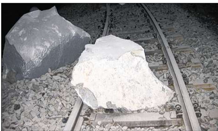
La crappuna ch'è vegnida sin il binari da la Retica sper Brusio.

■ (Iq) Las lavurs da rumida en connex cun la crudada da crappa sin il binari da la Viafier Retica dal mardi en la vischinanza dal viaduct a spirala sper Brusio cuzzan probablmain in mais. Quai ha mussà in giudicat dals exponents da l'Uffizi per guaud e privels da la natira, dal geolog, da las instanzas localas forestalas e dals spezialists da la Viafier Retica. Per pudair rumir a moda segira il material ch'è vegni a val stoppia ins far sco emprim in concept da serviglianza e metter quel en funcziun. Pir lura possia ins allontanar ils circa 30 000 meters cubics material davos il rempar. Allontanar quest material saja indispensabel per pudair