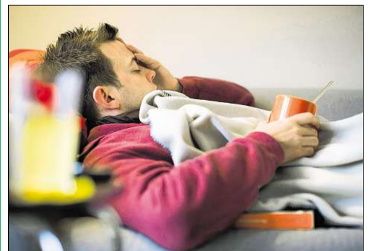
En noss chantun sa derasa la gripa en il mument cun ried.

garantir la segirtad da la viafier, per pudair segirar ils objects en la vischinanza e la via chantunala, scriva la Retica. Questa lavur vegnia a cuzzar duas emnas. Pir a la fin vegnian las rodaias reparadas. Durant quest temp porschia la Retica ina colliaziun sin via.