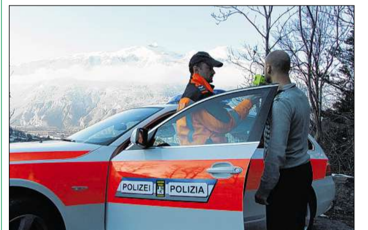
12 persunas han stuì dar giu immediat il permess dad ir cun auto. POCHA GR

L'economia svizra è main perturgada da la crisa da l'euro che quintà. Il barometer conjunctural da la Scola politecnica da Turitg ETH quinta per l'onn proxim cun in augment dal product naziunal brut da 1,2%. Dasper l'economia naziunala vegnia er il commerzi cun l'exteriur a crescer ils proxims mais. La chareschia vegnia a s'augmentar moderà e la dischoccupaziun vegnia a crescer minim sin 3,2%.