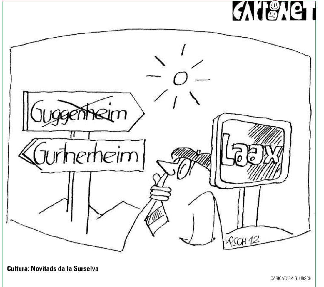
Cultura: Novitads da la Surselva