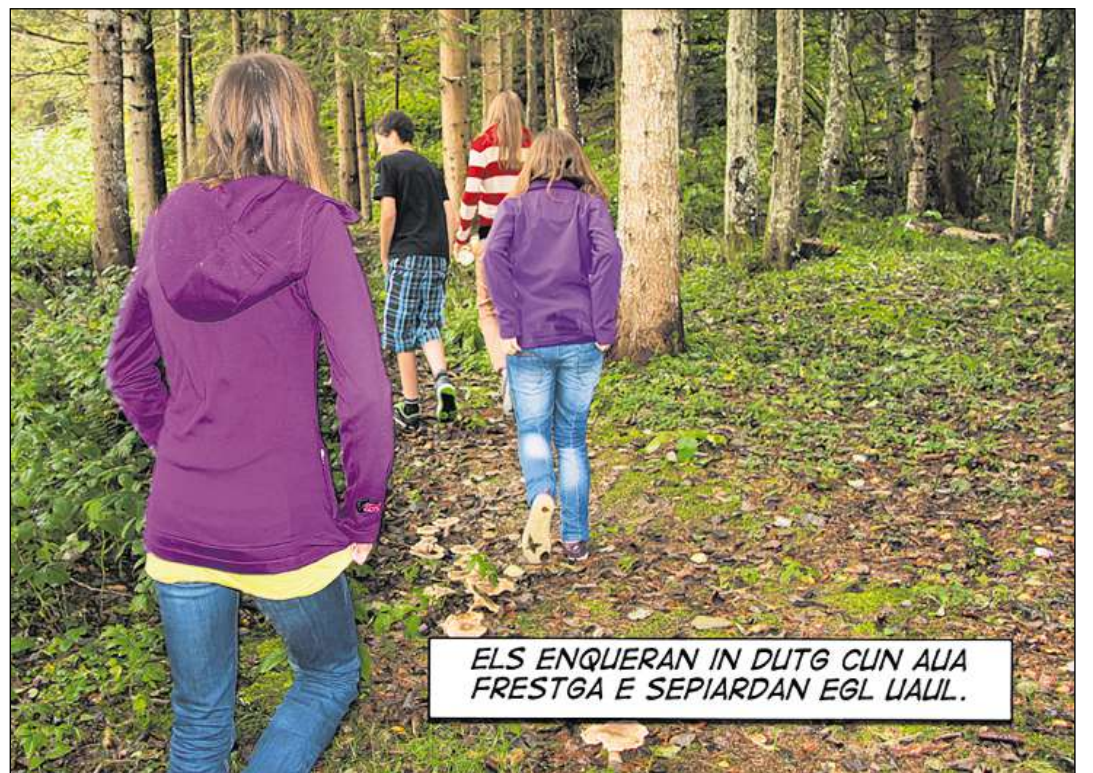
ELS ENQUIERAN IN DUTG CUN ALIA FRESTGA E SEPIARDAN EGL LIALL.