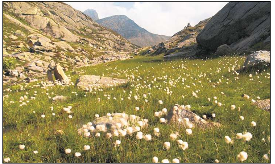
La bellezza dalla Greina san ins admirar la proxima fin d'jamna.