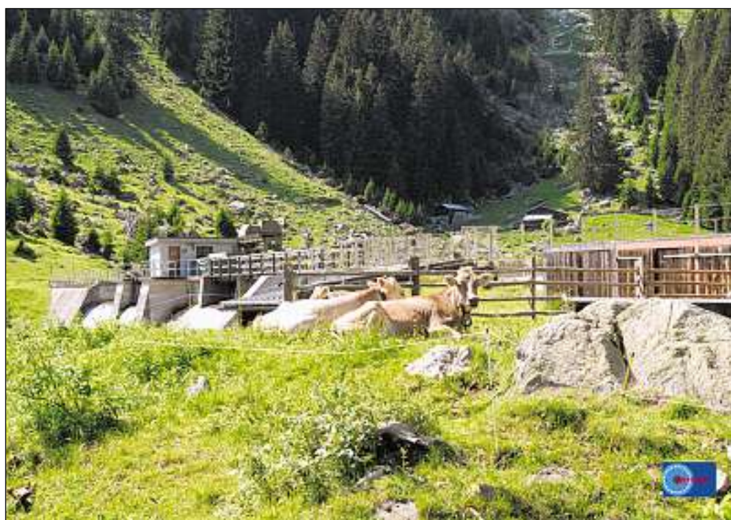
En connex cun l'engrondaziun dall'ovra vegn il mir d'accumulaziun a Barcuns alzaus per 5 meters.

■ L'Ovra electrica Russein po vegnir engrondida. La regenza ha approbau la nova concessiun e sancziunau la cunvegna cullas vischnaucas da Mustér e Sumvitg che regla il retourn a tschep dall'ovra. Il project ch'ei calculaus cun 70 milliuns preveda d'augmentar la capacitat da prestaziun dalla centrala dall'Ovra electrica Russein a 24 megawatts, aschia ch'ins sa quintar da niev cun ina producziun annuala da 64 uras gigawatt. Quei corrispunda al diever d'energia da rondund 16 000 casadas. En connex culla engrondaziun dall'ovra duei il mir d'accumulaziun che sesanfla a Barcuns vegnir alzaus per 5 meters. Plinavon ei previu da realisar in niev conduct da presiun sutterran sco era d'installar duos novas gruppas da maschinas egl edifices dalla centrala che sesanfla a Madernal. Reglau da niev han ins era la renunzia dallas vischnaucas alla curdada a tschep ch'era prevedida pigl onn 2027. Per quella renunzia vegn il maun pu-