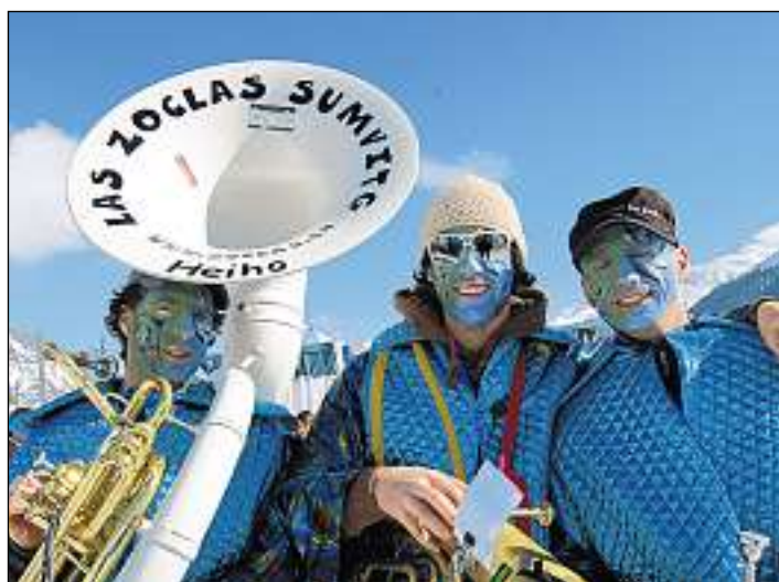
Las Zoclas da Sumvitg envidan damaun ad ina «Fiesta Mexicana» en sala da scola.